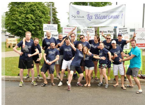
Course de bateaux-dragons 2017 Équipage Fonds de Bienfaisance Bombardier